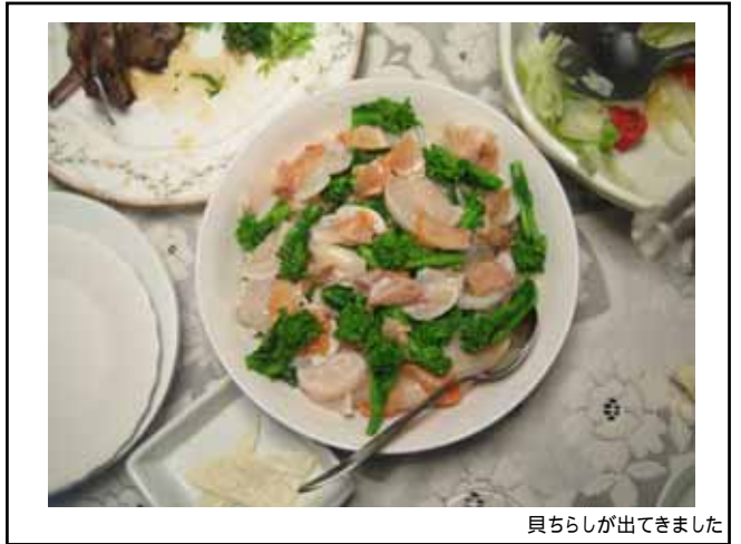
貝ちらしが出てきました