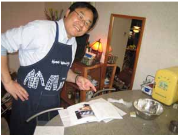
これから、ピザを作ります…