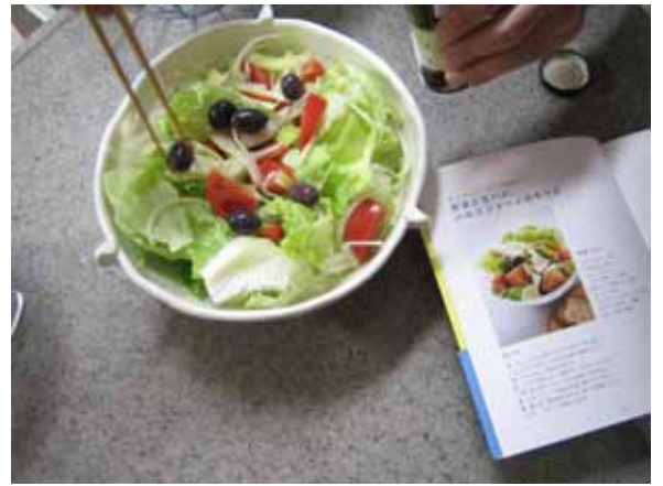
サラダのできばえを本と見比べて…うん、いいじゃん