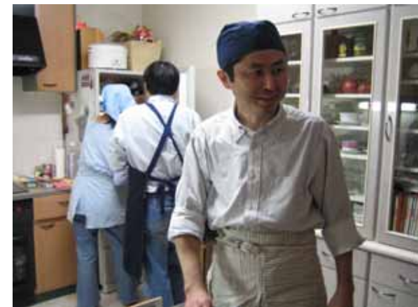
ラーメン屋さんのかっこうが、お気に入りです