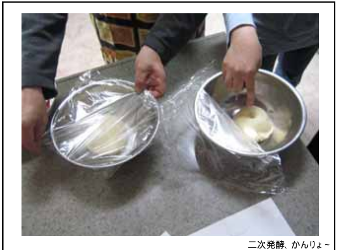
二次発酵、かんりょー