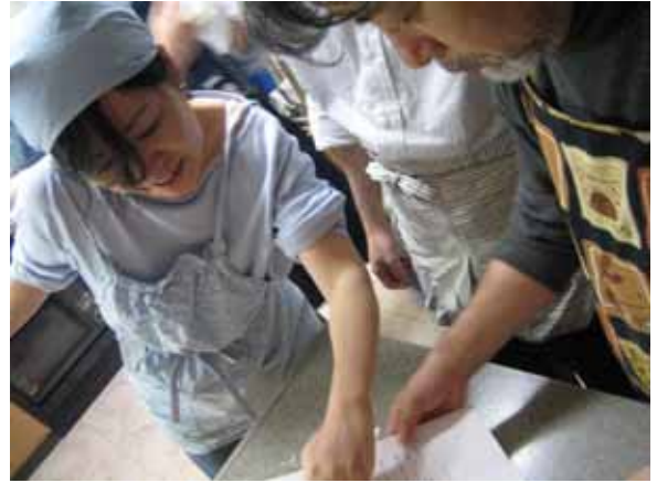
直ちゃん先生「あ～して、こ～して」、井上くん「ふむふむ」