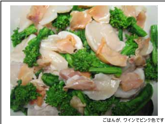
こはんが、ワインでピンク色です