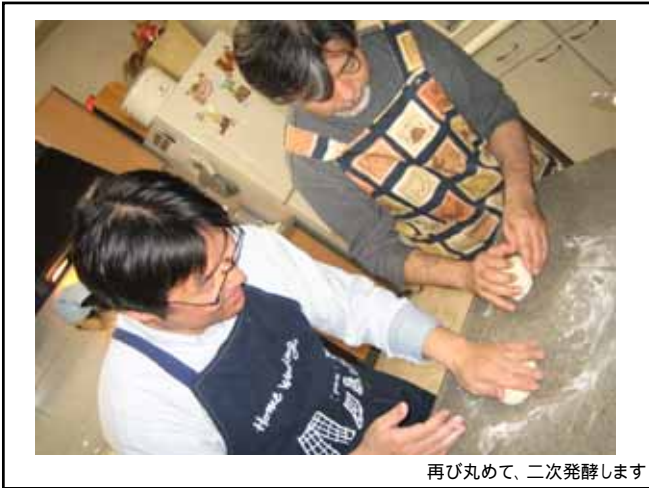
再び丸めて、二次発酵します