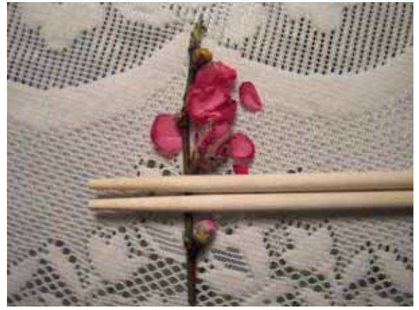
春らしく、お雑さまらしく