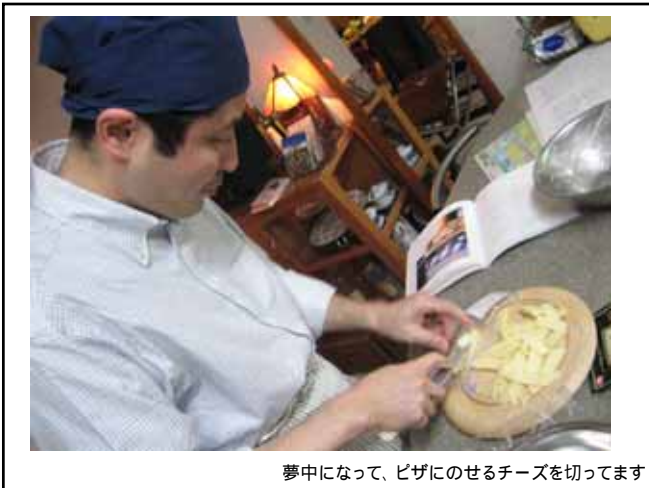
夢中になって、ピザにのせるチーズを切ってます