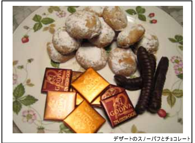
デザートのスノーパフとチョコレート