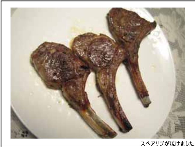
スペアリブが焼きました