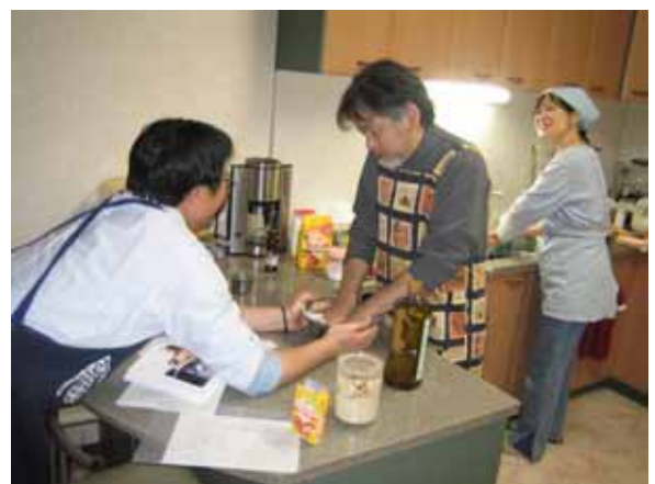
まずは、粉を混ぜて生地作り