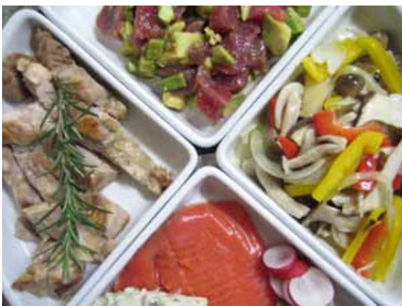
なかなかよいいどりです