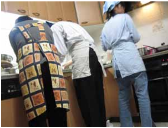
洗い物班の助っ人に…