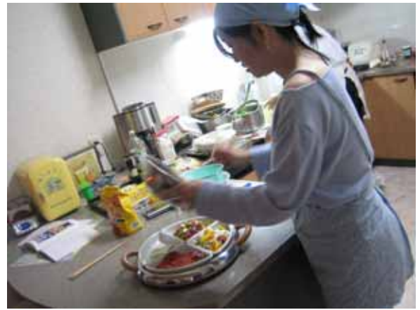
いつのまにか、直ちゃんがいるんなものを作っていました