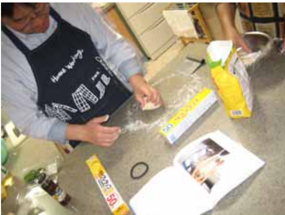
一次発酵が終了したピザ生地は、丸めてガス抜きます