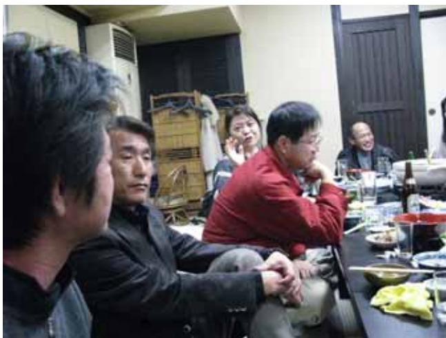
5時ごろになってだいぶ人が増えました