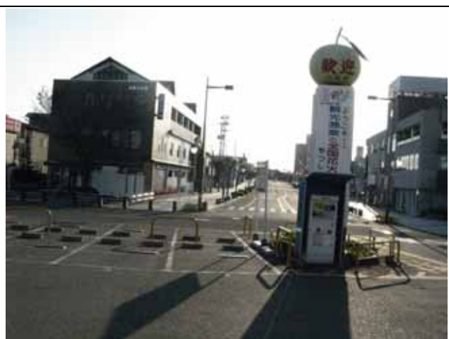
駅前の真正面の道を進みます