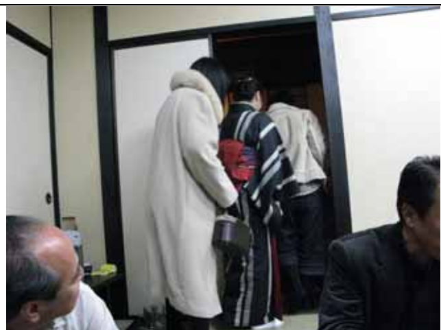
9時ごろになり、ポツポツお帰りです