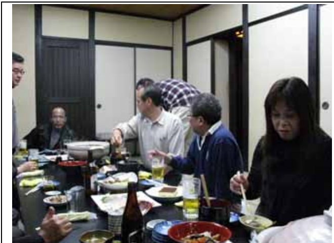
4時過ぎに始まりました