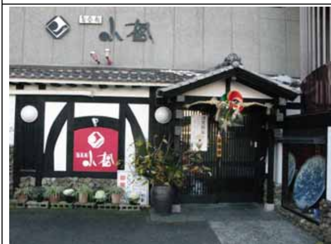
お店の入り口です